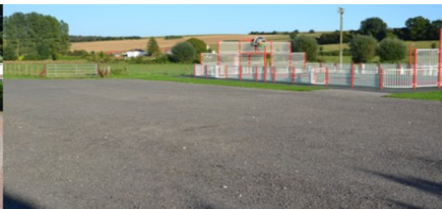
Le parking du stade municipal