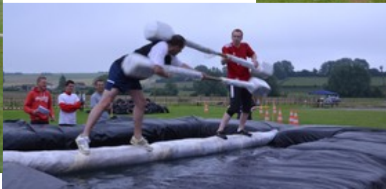
Joute avec des cotons tiges géants.....