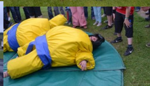
Dur, dur !!!! le combat de Sumo...

Pour les internautes, n'oubliez pas le site de la commune: http://www.blangy-sur-ternoise Prochain bulletin: Début Septembre 2013