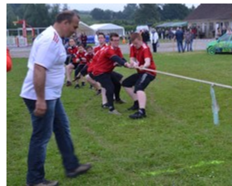
Le tir à la corde : Attention ! l'arbitre surveille.....

Dimanche 30 juin, le Syndicat d'initiative organisait la troisième édition des Jeux Inter-villages. En 2012, l'équipe de Blangy avait terminé à la deuxième place et espérait bien cette année finir première mais les quatre autres équipes engagées, Fillièvres, Le Parcq, Vieil-Hesdin et Willeman n'étaient pas décidées à lui rendre la partie facile. Au travers d'épreuves sportives mais nécessitant une très bonne condition physique, les spectateurs ont pu assister à des rencontres spectaculaires et humoristiques. Le tir à la corde, la joute avec des cotons tiges géants, le combat de sumo, le rodéo, le lancer de balle et le fil rouge qui consistait à construire un radeau, ont permis de départager les équipes pour donner le classement final suivant: 1)Willeman 2) Blangy 3) Fillièvres 4) Vieil-Hesdin 5) Le Parcq. Tout au long de la journée, le jeune public pouvait profiter de structures gonflables et d'un taureau mécanique. Cette journée récréative restera un très bon souvenir pour les participants et le public.