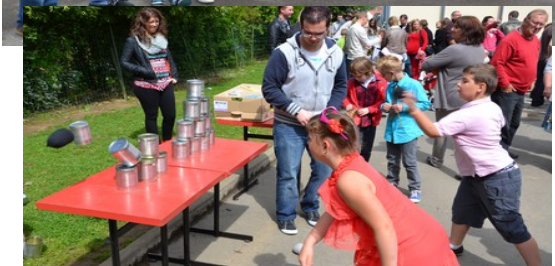
Les champions du « Chambole-tout »