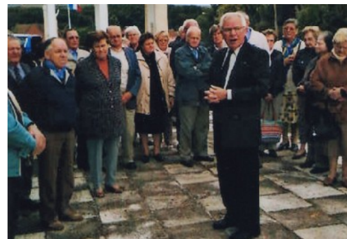
Les membres de l'association lors d'un dépôt de gerbe au mémorial de Souchez