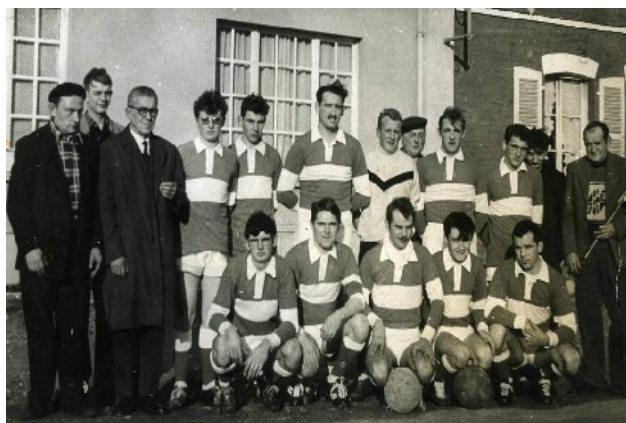
L'équipe senior de la JSB en 1963

Pour les internautes, n'oubliez pas le site de la commune: http://www.blangy-sur-ternoise.com