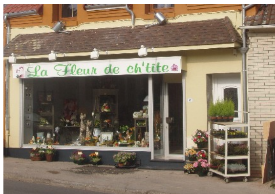
Un nouveau magasin au village

Mardis 09 et 23, même horaire avec pour la dernière séance de l'année, la fête de tous les anniversaires du dernier trimestre.